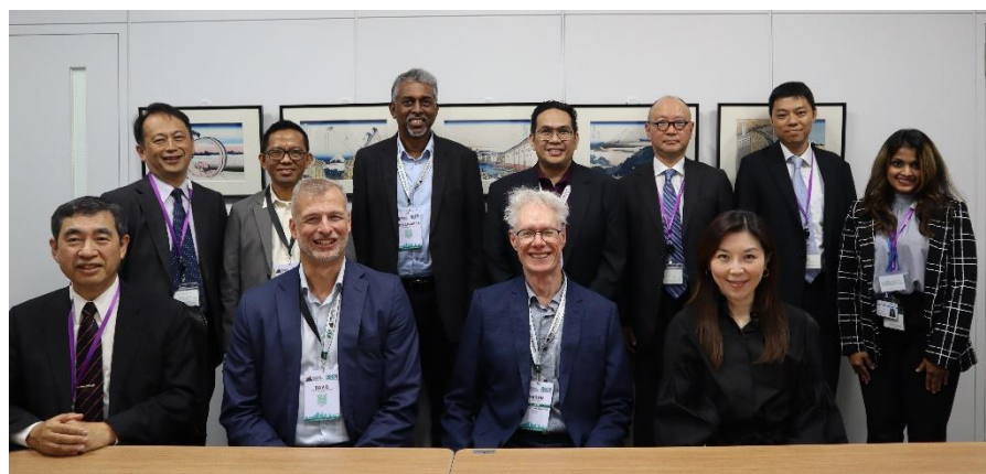
BKR Board Members の当法人への表敬訪問

10月28日からの世界会議に先立って10月25日には BKR Board Members の当法人への表敬訪問、Board Meeting、歓迎会が行われ親交を深めました。